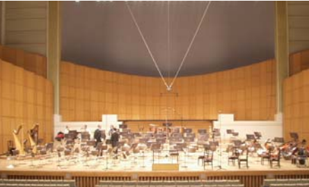
1. November 2003 TSUKUBA , Nova Hall