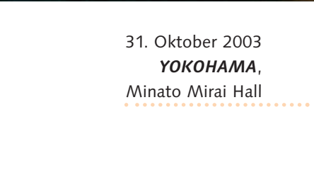
31. Oktober 2003 YOKOHAMA , Minato Mirai Hall