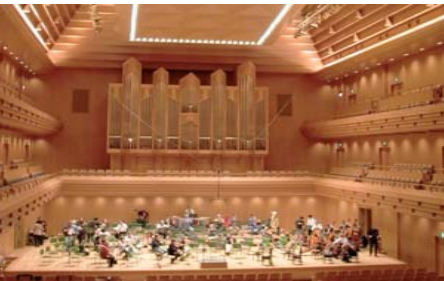
4. / 5. / 6. November 2003 TOKYO , Opera City Concert Hall