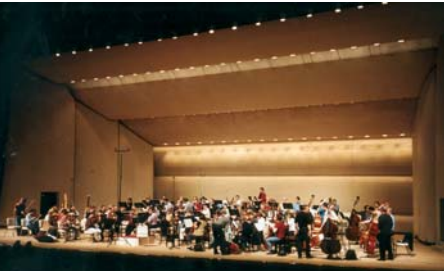
29. Oktober 2003 OSAKA , Festival Hall